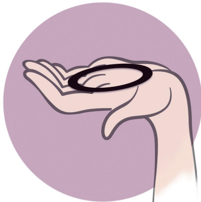
Abbildung 1 Nehmen Sie FemLoop® Vaginalring aus dem Beutel.